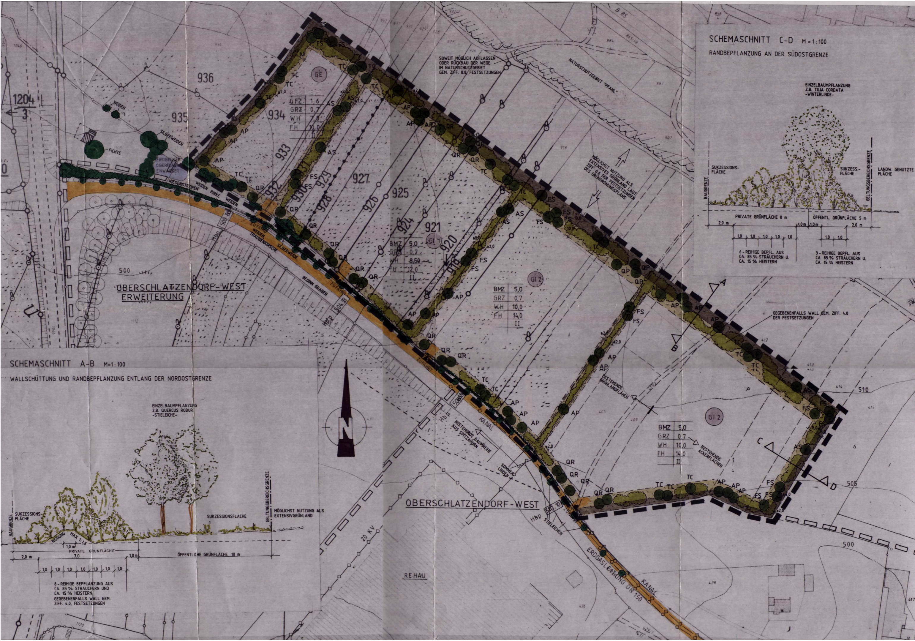
SCHEMASCHNITT C-D M=1:100 RANDBEPLANZUNG AN DER SÜDOSTGRENZE