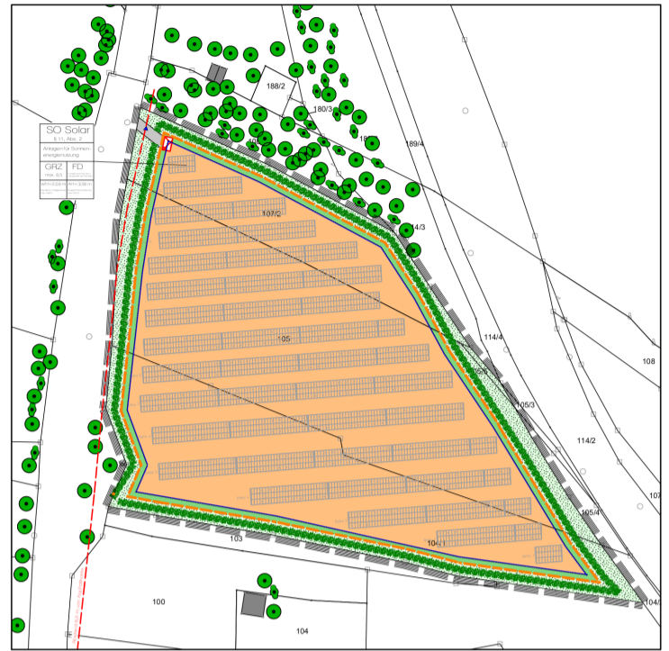
Satzungsbereich M_1_2.000 ohne Anbauverbotszonen und Biotopflächen